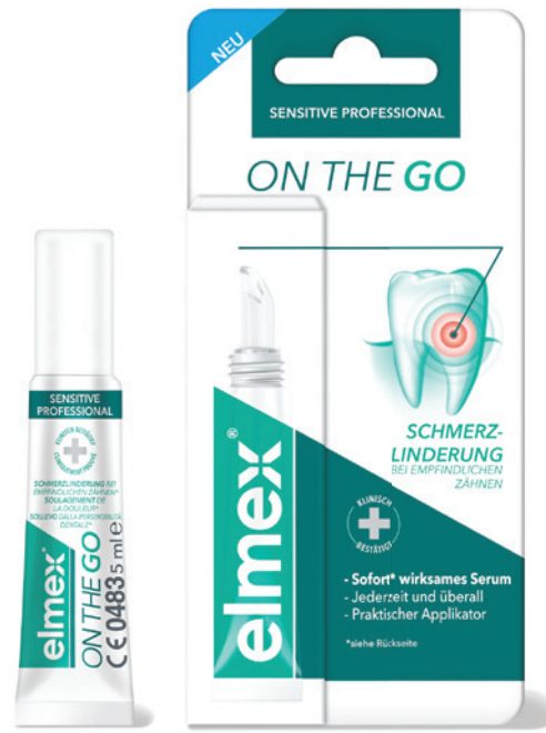
elmex® SENSITIVE PROFESSIONAL On the Go.

Anstatt aufgrund sensibler Zähne verschiedene Speisen und Getränke zu meiden, können Betroffene elmex® SENSITIVE PROFESSIONAL On the Go ergänzend zu ihrer täglichen Zahnpflege mit Zahnpasta und Zahnpoliermittel anwenden. Das neue Produkt ist klein und handlich. Über den Silikon-Applikator kann das Serum einfach und hygienisch direkt auf den empfindlichen Zahn aufgebracht werden. Die Formel enthält kein Fluorid und keine Abrasivkörper und das Serum muss anschließend nicht ausgespült werden. Ein elmex®