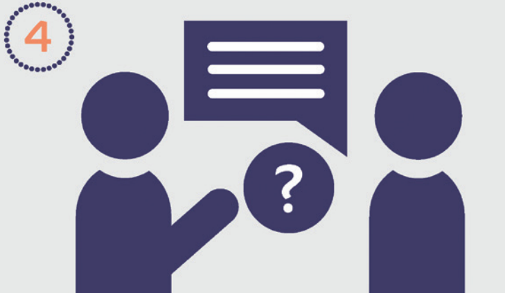
Abb. 1–4: Nutzer können mit CAD Configurator ihre Anforderungen spezifizieren. Sie erhalten eine individuelle Empfehlung mit den Softwareprodukten, die diese Anforderungen am besten erfüllen, und eine Liste mit den Kontaktdaten der Reseller, die in dem Land des Interessenten präsent sind.

schritte geführt: Im ersten Schritt wird die Länderauswahl getroffen, danach der Einsatzbereich – also Dentallabor, Chairside, oder Praxislabor – und im dritten Schritt gibt der zukünftige Nutzer die Indikationen an, für die die Software genutzt werden soll. Individuelle Software-Empfehlungen mit den möglichen Lizenz-Modellen werden dann direkt per Mail an den Nutzer geschickt.