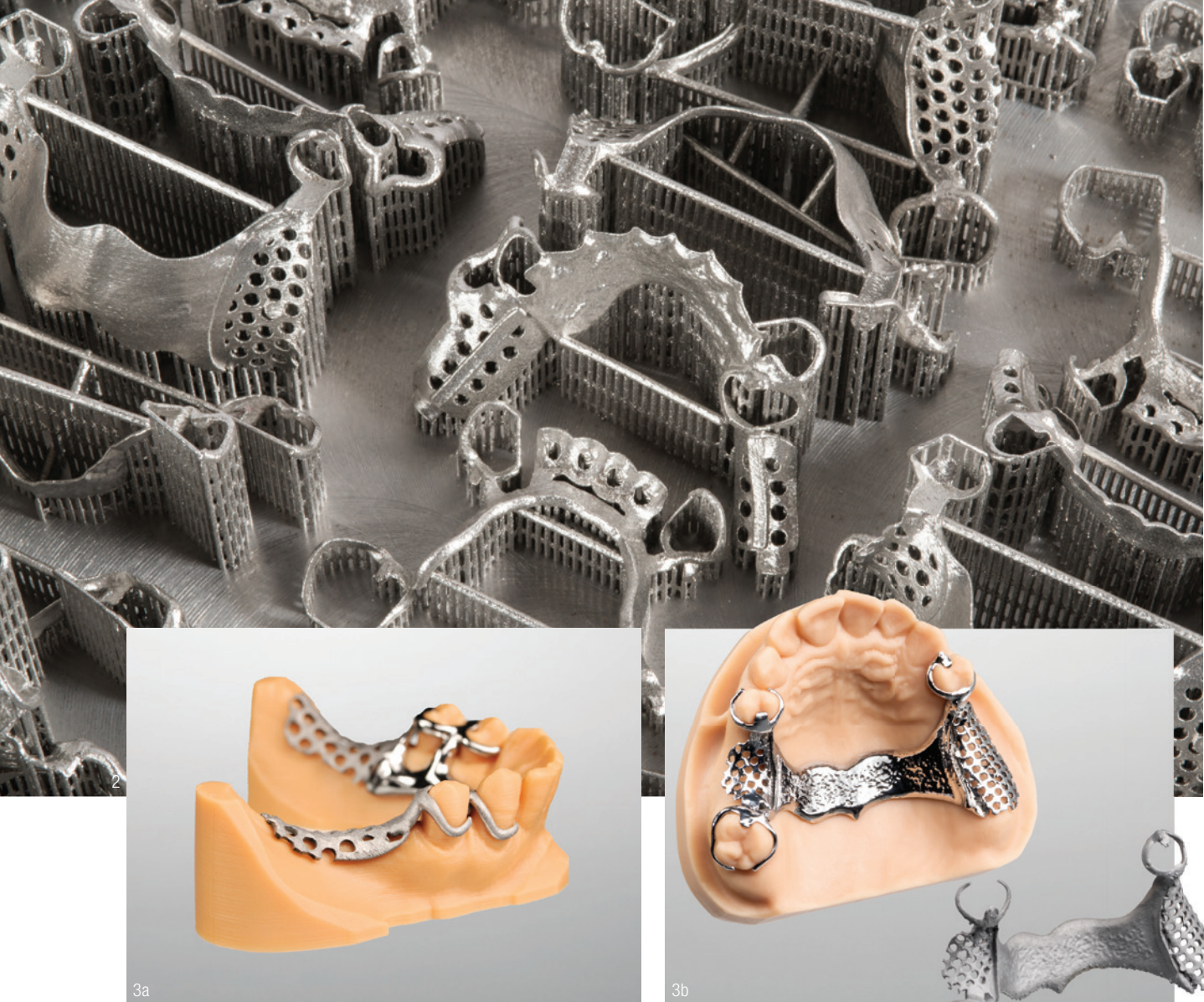
Abb. 1: exocad PartialCAD Design eines UK-Modellguss. Abb. 2: Modellgussprothesen auf Bauplattform. Abb. 3a: Modellgussprothese (UK) auf gedrucktem Modell. Abb. 3b: Modellgussprothese (OK), hochglänzend (links) und basis (rechts).

der Modellguss auch bereits industriell vopolyert angeliefert werden. Nach erfolgreicher Anprobe kann im Labor mit der Aufstellung und Finalisierung im gewohnten Prozess begonnen werden.