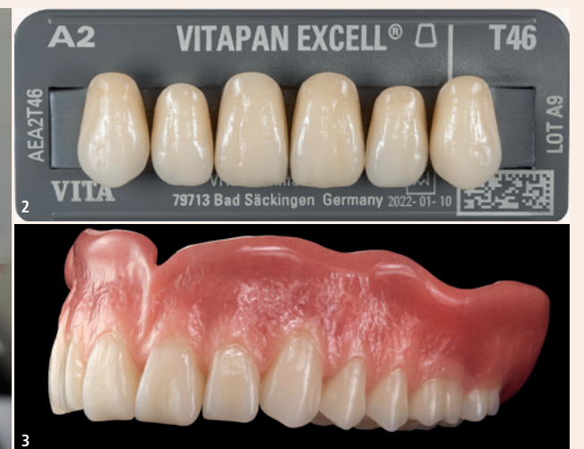
Abb. 1: Bei Petersen Dental werden seit jeher VITA-Zähne für die Teil- und Totalprothetik verwendet. – Abb. 2: VITA-Zähne bieten für jeden Patienten die richtige Zahnform. – Abb. 3: Naturidentische Totalprothese mit dem VITAPAN EXCELL.