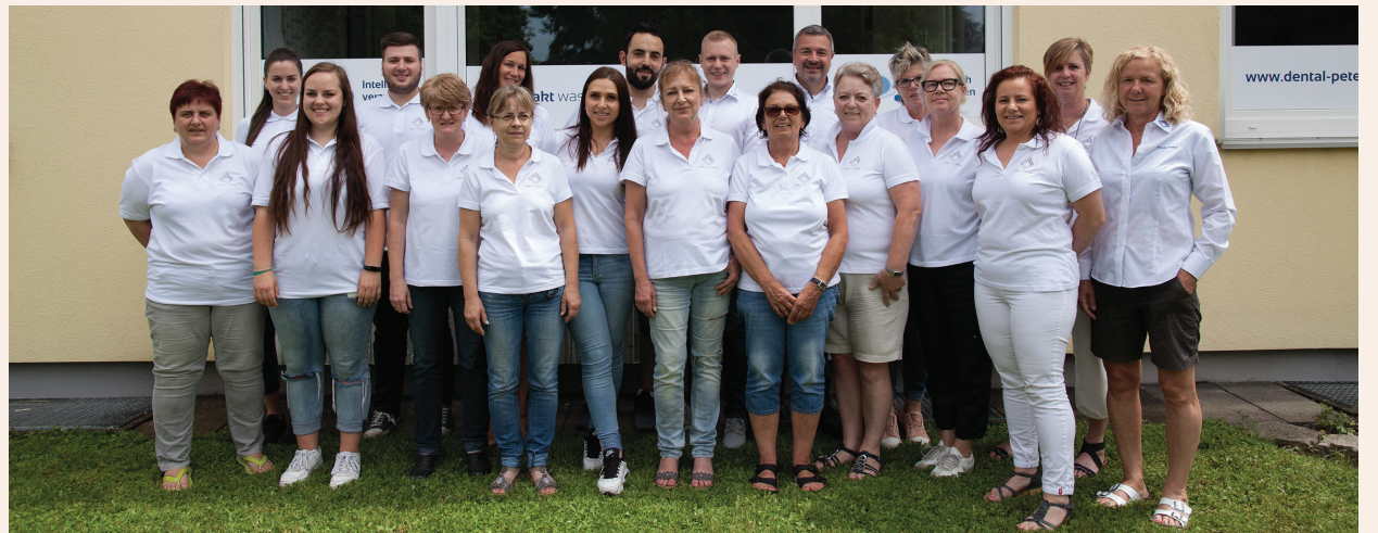
Das Team von Petersen Dental ist die tragende Säule für hochwertigen Zahnersatz made in Germany.

Wir arbeiten schon seit über 50 Jahren mit VITA-Zähnen und haben nie andere Konfektionszähne verwendet. Die Materialqualität der Zähne ist hervorragend und hat sich über den gesamten Zeitraum