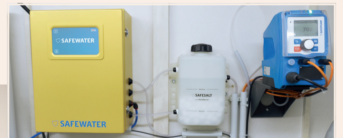
Zentral implementiert versorgt SAFEWATER sämtliche Entnahmestellen der Trinkwasserinstallation der Praxis.

„Die neue Behandlungseinheit soll natürlich lange im Einsatz sein. Bevor das Wasser also nun über mehrere Jahre verkeimt oder die Einheit unter der Aggressivität anderer Reinigungsmittel leidet, war mir wichtig, von Anfang an eine Lösung zu wählen, die das gesamte Wassersystem zuverlässig aufbereitet und gleichzeitig die Materialien schont. So können wir langfristig Reparatur- und Neuan-