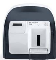
Scan eXam™ One