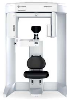
OP 3D™ Vision