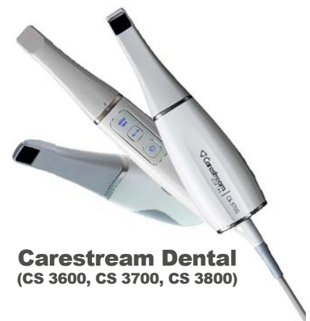
Carestream Dental (CS 3600, CS 3700, CS 3800)