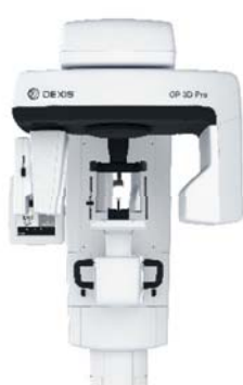
OP 3D™ Pro