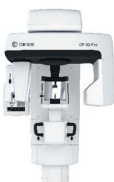
OP 3D™ Pro