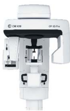
OP 3D™ Pro