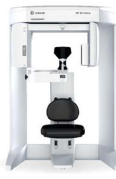
OP 3D™ Vision