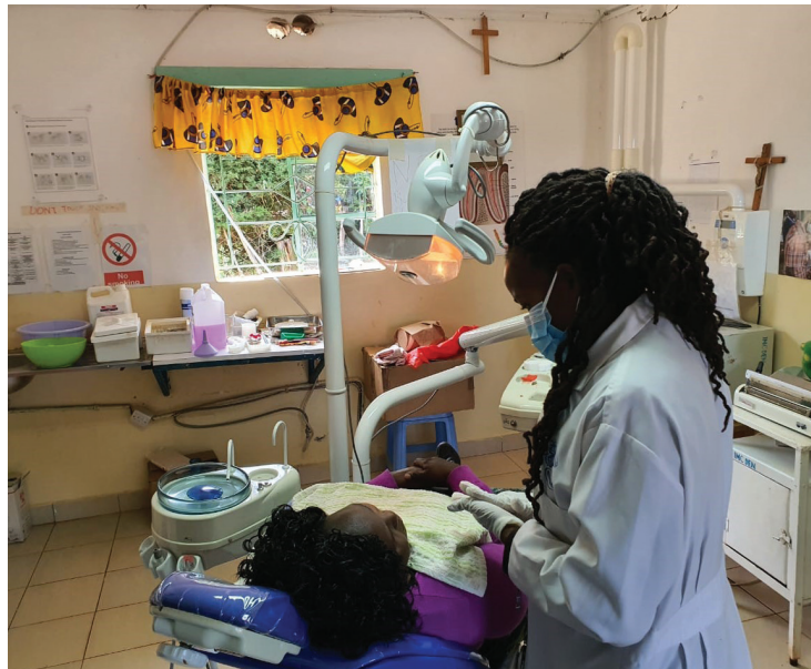
Fokus des Vereins liegt auf der kompetenten Aus- und Weiterbildung von einheimischem Fachpersonal.

Mit einer erneuten Spende von 5.900 Euro unterstützt Henry Schein Dental Deutschland die Arbeit des Vereins Dentists for Africa e.V. (DfA). Eingesetzt wird das Geld u. a. für die Prävention von Zahnkrankheiten, Reihenuntersuchungen und die Behandlung von Schulkindern sowie für die zahnmedizinische Weiterbildung der kenianischen Behandler in den DfA-Zahnstationen. Dentists for Africa e.V. leistet einen wichtigen Beitrag zur Verbesserung der zahnmedizinischen Situation für benachteiligte Menschen in Kenia, stets unter dem Motto „Hilfe zur Selbsthilfe“. Den Verein Dentists for Africa e.V. gibt es bereits seit über 20 Jahren. Das Ziel: Die zahnmedizinische Versorgung der mittellosen Bevölkerung Afrikas durch die Einrichtung von Zahnstationen und die Organisation von Hilfseinsätzen nachhaltig und dauerhaft zu verbessern. Seit dem Bau der ersten Zahnstation 1999 hat der Verein eine ganze Reihe von Einrichtungen zur zahnmedizinischen Grundversorgung ausgestattet, die von kenianischen Oral Health Officers, Zahn Technikern, Medical Engineers und Zahnmedizinstudenten betreut werden. Fokus des Vereins liegt auf der kompetenten Aus- und Weiterbildung von einheimischem Fachpersonal.