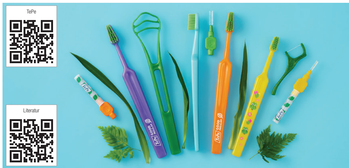
Bei TePe legt man bereits seit Jahren viel Wert auf Nachhaltigkeit und Klimaschutz. Dies spiegelt sich auch im Produktsortiment wider.

TePe D-A-CH GmbH Langenhorner Chaussee 44 a 22335 Hamburg Tel.: +49 40 570123-0 Fax: +49 40 570123-190 kontakt@tepe.com www.tepe.com