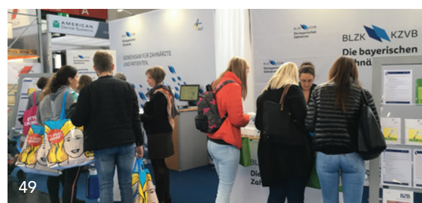
id infotage dental München 2022 – viele Serviceangebote und Beratung vor Ort.