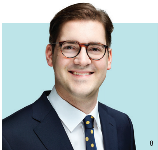
MdB Stephan Pilsinger kommentiert das GKV-Finanzstabilisierungsgesetz.