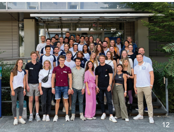
Auf große Resonanz stieß die zweite Bayerische Fachschaftstagung für Studierende der Zahnmedizin, die in diesem Jahr in Erlangen stattfand.