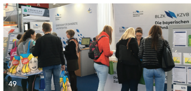
id infotage dental München 2022 – viele Serviceangebote und Beratung vor Ort.