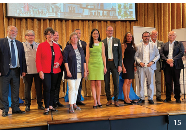
Beim Sommerempfang von KZVB und KVB gab es klare Worte in Richtung Berlin.