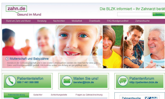
zahn.de ab 2013: Bereits kurz nach ihrem Start bekommt die Seite ein deutlich moderneres und nutzerfreundlicheres Design.