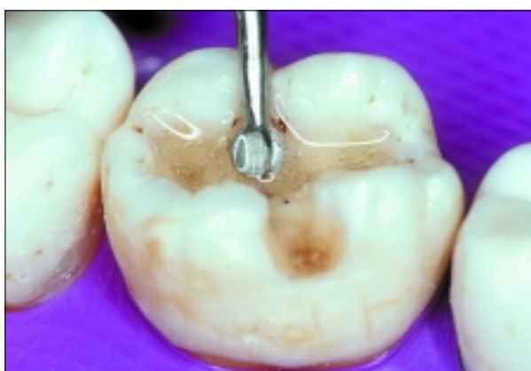
Rosenbohrer oder minimalinvasive Exkavation: Gibt es eine „Revolution“ bei der Kariesbehandlung im Dentin?