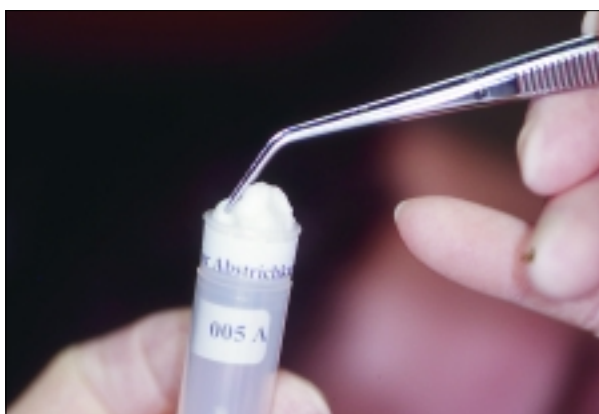
Das individuelle Kariesrisiko kann genau bestimmt werden