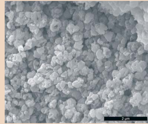
Neue hydrophile Oberfläche ZERAFIL™.