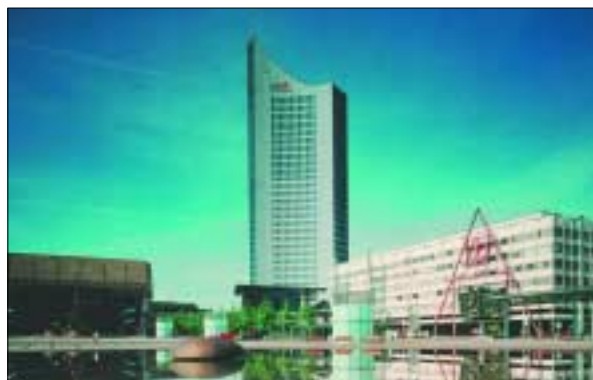
Leipziger Forum für Innovative Zahnmedizin