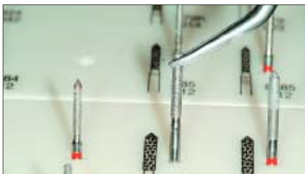
Infektionsschutz und Hygiene