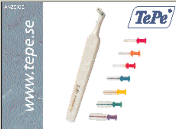
Die Beiträge in dieser Rubrik stammen von den Herstellern bzw. Vertreibern und spiegeln nicht die Meinung der Redaktion wider.

Produktpalette im Bereich der mit Licht ausgestatteten Instrumentenreihe. Mit ihnen ist kraftvolles und leises Arbeiten möglich. Zudem sind sie einfach an die Luftturbinen-Kupplung anzuschließen. Dank der Ringbeleuchtung hat man mit den Scalern hervorragende Lichtverhältnisse im benötigten Arbeitsgebiet, was die Behandlung erleichtert und beschleunigt, ohne den Behandler zu belasten. Der Körper der Handstücke besteht aus Titan. Die natürliche Beschaffenheit von Titan bietet einen sicheren Griff mit hoher Tastsensibilität. Dank der Verwendung von Titan ist es NSK möglich, Produkte herzustellen, die leichter