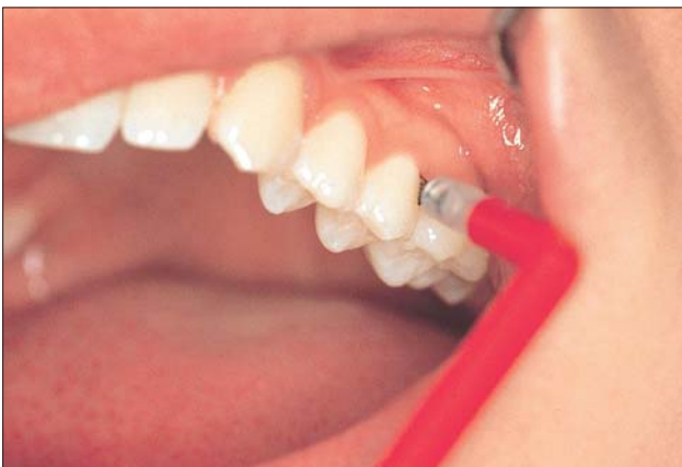
Ein Scan-Programm für das individuelle Kariesrisiko