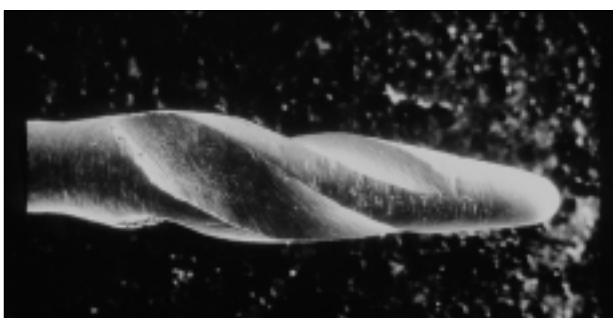
Wurzelkanalaufbereitung mit LightSpeed-Instrumenten Seite 34