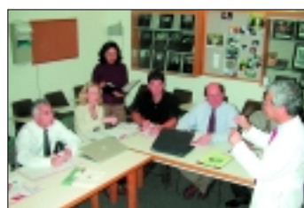
The International Program at the University of Philadelphia/Pennsylvania – USA

39 The International Program at the University of Philadelphia/Pennsylvania – USA