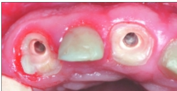
Wurzelstifte im Wandel der Zeit Seite 10