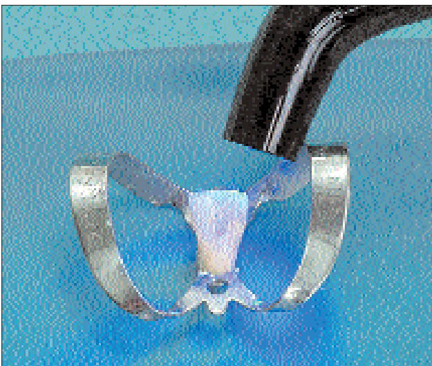
Dentin-Bonding erreicht das Wurzelkanal-System