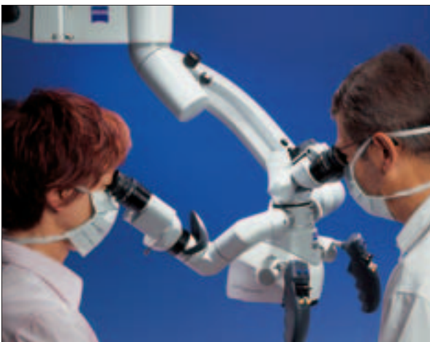
Endodontie mit dem Dentalmikroskop