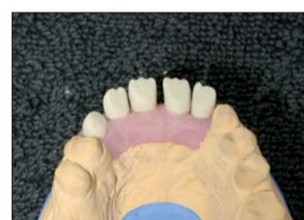
Abb. 15: Um in den fertigen Verblendungen keine sichtbare Kante der Zirkongerüste zu haben, schleifen wir schon in die Zirkonkappen eine Mamelonstruktur.