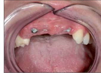
Abb. 3: Normalerweise sind die Implantate sauber – eine bessere Mundhygiene ist der Patientin zu empfehlen.

fertige Modell werden nun die aufbrennfähigen Abutments geschraubt und man erkennt