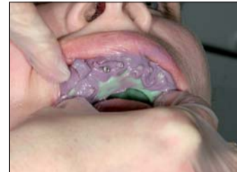
Abb. 6: Bei der Abdrucknahme ist immer darauf zu achten, dass die Schraubenkanäle mit Wachs verschlossen sind.