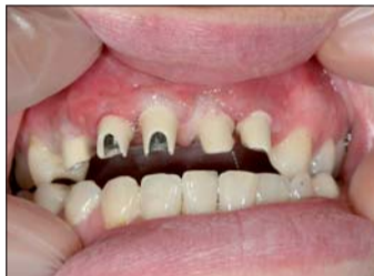
Abb. 28: Die Abutments entwickeln einen starken Druck auf die Papille; um die Interdentalräume so weit es geht zu schließen, ist das notwendig.

und der Verlauf der Schneidekanten wirken sehr natürlich (Abb. 19). Die Inzisalkanten sind dezent nach labial geneigt und bilden einen Kreisbogen zur Unterkieferumschlagfalte (Abb. 20 und 21).