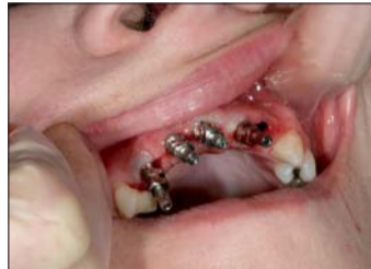
Abb. 4: Die Abdruckpfosten werden eingeschraubt und die Abformung vorbereitet.