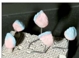
Abb. 16: Die Kronen sind geschichtet und fertig für den ersten Brand.