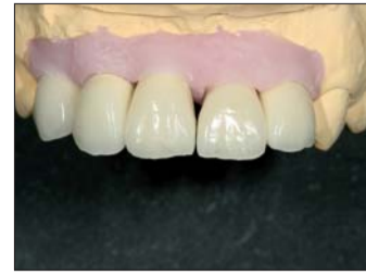
Abb. 24: Nach der Einprobe waren kleine Korrekturen notwendig. Die Zähne 11, 12 und 13 mussten etwas verlängert werden ...

aus Pattern Resin an. Aufgrund der Divergenzen der Implantate 12 und 13 mussten