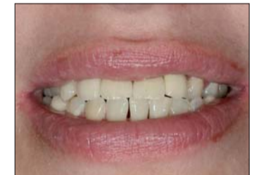
Abb. 31: Der Zahn 22 wurde noch gekürzt und komplett außer Funktion gestellt.

Nachdem die Implantataufbauten bei der zweiten Einprobe eingeschraubt waren, konnte man sehr gut anhand der Anämie bei den beiden Einsern erkennen, wie viel Druck die Aufbauten auf das Zahnfleisch ausübten (Abb. 28). Dieser Druck ist