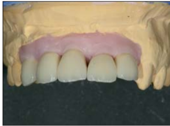
Abb. 25: ... und dementsprechend mussten wir einen erneuten Glanzbrand durchführen.