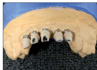
Abb. 11: Die aufbrennfähigen Aufbauten sind mit Keramik individualisiert. Am Fräsergrat wurden die 2° konisch gefräst und mit einer Stufe versehen.