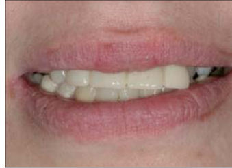
Abb. 1: Die ursprünglich progenen Verzahnung wurde durch Ziehen der Zähne und Tragen einer Klammerprothese behoben.

den Abdruck und fertigen als erstes die Zahnfleischmaske an. Hierfür verwenden wir das