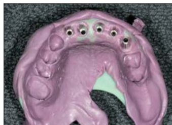
Abb. 7: Bei der Herstellung des Löffels hätten wir im Bereich der Implantate ein bisschen mehr ausblocken müssen.