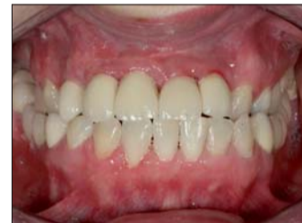
Abb. 30: Im Schlussbiss zeigt sich die gute Farb- anpassung vom Ober- zum Unterkiefer.

wir den Übertragungsschlüssel hier trennen. Eine Markierung mit einem wasserfesten Filzschreiber ermöglicht dem Behandler trotz der Trennung die korrekte Position der Implantate zu finden (Abb. 23).