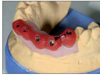
Abb. 23: Da es nicht möglich war, den Übertragungsschlüssel im Ganzen abzunehmen, mussten wir ihn trennen. Die Anzeichnung hilft dem Behandler auch das Implantat 13 richtig einzusetzen.

Und dass die Inzisalkanten von Ober- und Unterkiefer parallel zueinander verlaufen,