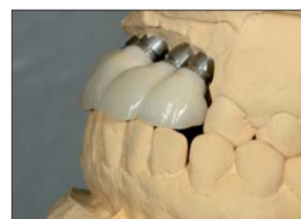
Abb. 21: ... und die Inzisalkante bildet einen Kreisbogen in die Unterkieferumschlagfalte.

sofort, dass das Implantat für den Zahn 21 deutlich hinter dem Implantat 22 steht. Das erschwert leider unsere Arbeit, da wir für einen harmonisch verlaufenden Zahnbogen den Aufbau 21 nach vestibulär dicker gestalten und eventuell auf das Zirkon-