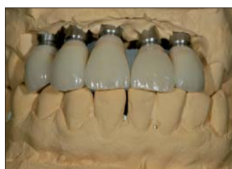
Abb. 19: Die fertiggebrannten Kronen auf dem Modell.

Material SHERAGINGIVAL. Dieses Zwei-Komponenten-Material wird mit einer Spezialkartusche und aufgesetzter Mischkanüle direkt in den Abdruck gespritzt. Vorher isolieren wir den Abdruck mit SHERASEPAL gegen Silikone und Polyäther, da die zahn-