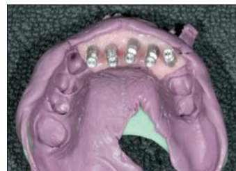
Abb. 8: Das Material für die Zahnfleischmaske spritzen wir mit einer Spezialkartusche und aufgesetzter Mischkanüle direkt in den Abdruck.