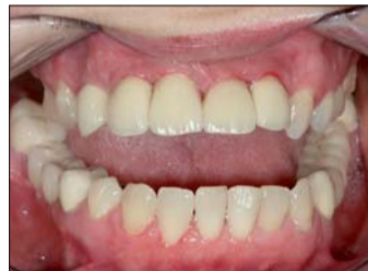
Abb. 29: Bis auf eine kleine Entzündung an 23 hat sich die Gingiva gut entwickelt und die Papillen haben sich schön ausgeformt.

rundet das ästhetische Erscheinungsbild ab (Abb. 22). Um die Implantate bei der Anprobe in der Praxis analog der Modellsituation positionieren zu können, fertigen wir einen Übertragungsschlüssel