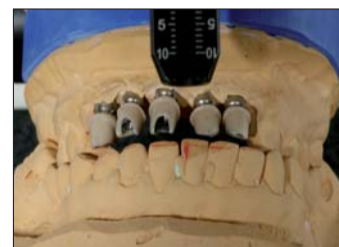
Abb. 12: Die individualisierten Aufbauten sind so gestaltet, dass die Zirkonkappen eine einheitliche Wandstärke haben werden und die Schichtstärke der Keramik bei jeder Krone annähernd gleich ist.