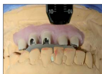
Abb. 14: Die Stufen der keramisch individualisierten Aufbauten liegen deutlich unter dem Zahnfleisch.