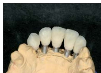
Abb. 17: Der erste Brand ist in Form geschliffen und es bedarf nur noch weniger Korrekturen.