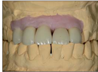
Abb. 26: Der Überbiss im ersten Quadranten ist jetzt etwas größer ...