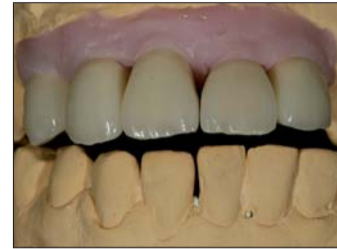
Abb. 27: ... und die Inzisalkanten von Ober- und Unterkiefer verlaufen nun parallel zueinander.