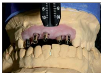
Abb. 10: Neben den nicht ideal gesetzten Implantaten wird uns auch der Kreuzbiss Probleme bereiten.