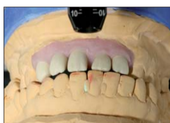
Abb. 13: Damit die Verblendungen nicht wegbrechen, sind die entscheidenden Punkte in stabilem Zirkon abgefangen.