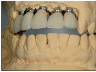
Abb. 22: Die Stufe in der Unterkieferfront hatten wir in der Oberkieferinzisalkante zu wenig berücksichtigt. Eine Korrektur folgte später.

gebnis nach dem Glanzbrand sind wir sehr zufrieden. Der leichte Überbiss der Kronen