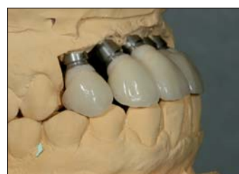
Abb. 20: Die Labialflächen der Kronen zeigen auf den Kieferkamm ...

das Material ausgehärtet und wir beschneiden die Enden mit dem Skalpell; so kann die Zahnfleischmaske leichter aus dem Modell genommen und wieder eingesetzt werden. Nun können wir unser Pindex-Modell wie gewohnt anfertigen (Abb. 8). Auf das