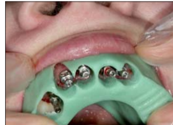
Abb. 5: Unsere individuellen Löffel reduzieren wir immer auf das Wesentliche; alles Überflüssige quält nur den Patienten.