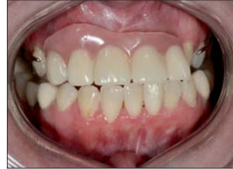
Abb. 2: Die alte Prothese ist ästhetisch und funktional völlig inakzeptabel.

fleischfarbene Silikonmaske sonst nicht vollständig aushärtet. Nach 15 Minuten ist