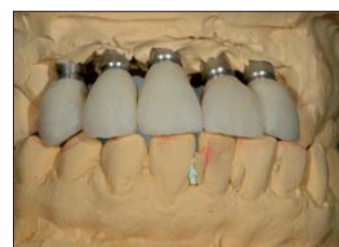
Abb. 18: Die Oberflächenstruktur ist herausgearbeitet und die Kronen fertig für den Glanzbrand.