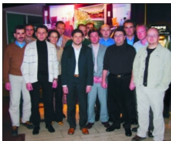
Studiengruppentage in Leipzig