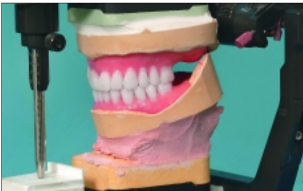
Erweiterte Möglichkeiten in der präimplantologischen Planung mittels neuartiger radiopaker Prothesenzähne