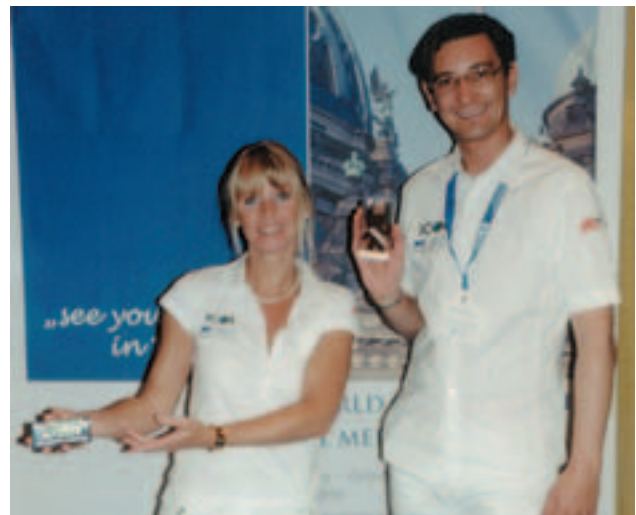
Das Team des DGZI-Standes.