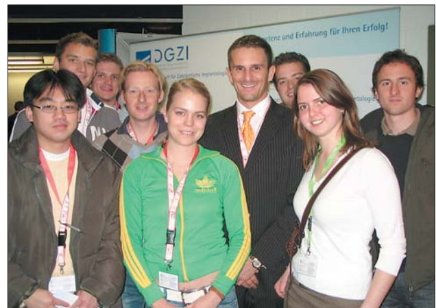
Aktuelles – Studenten wichtige Zielgruppe für die DGZI