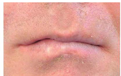
Abb. 7: Bisschablone mit Magnetkappe. – Abb. 8: Patient ohne Bisschablone. – Abb. 9: Patient mit Bisschablone.