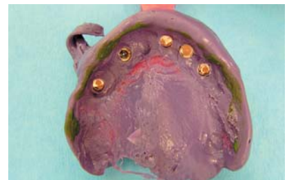
Abb. 4: Situation nach Insertion der Implantate. – Abb. 5: Magnetattachments. – Abb. 6: Funktionsabformung.