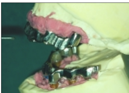
Bestrahlter Kiefer und Implantatsofortbelastung Seite 20