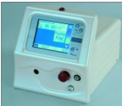
Diodenlaser (Wattbereich) Seite 12

36 Nachtrag zur Marktübersicht Ästhetik-komponenten aus Keramik