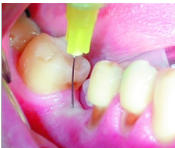
Neue Technologien in der Lokalanästhesie Seite 26

26 Neue Technologien in der Lokalanästhesie ZA Stefan Scherg