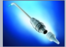
FRIOS® Bone Collector