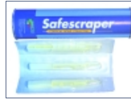
Safescraper/Safescraper Curve Set