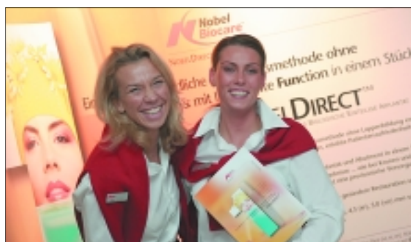
Frischer Wind bei Nobel Biocare Seite 42

42 Frischer Wind bei Nobel Biocare Heike Geibel