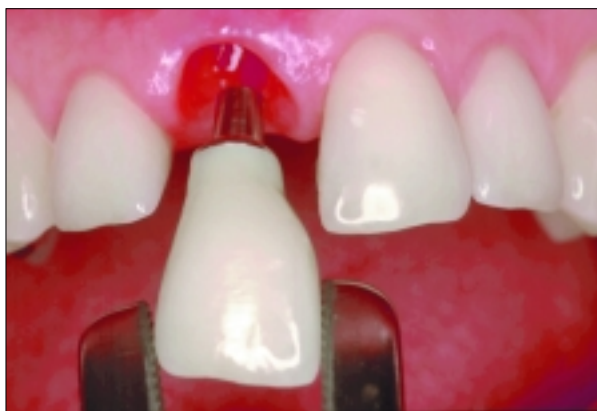
Frontzahntrauma Seite 18