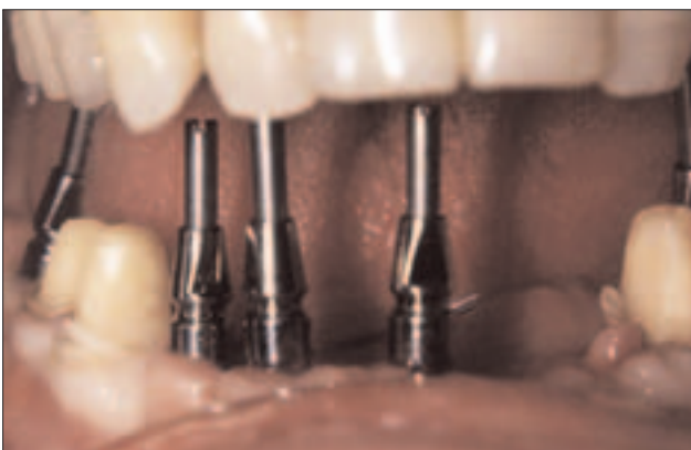
Sofortversorgung und Sofortbelastung unter Praxisbedingungen