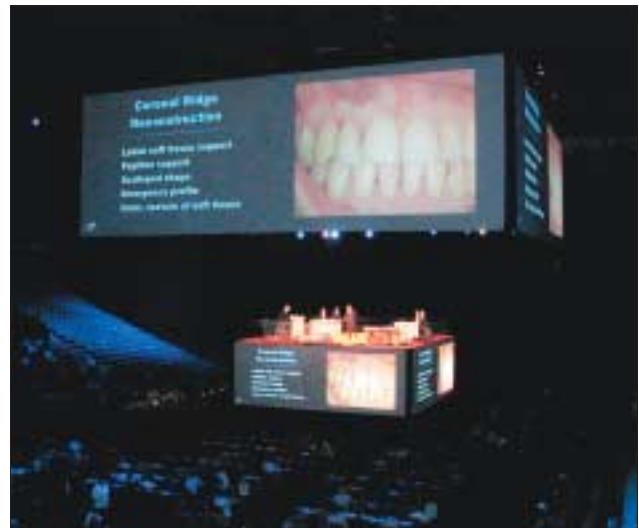
Willkommen in Las Vegas!

49 Willkommen in Las Vegas! Jürgen Isbaner