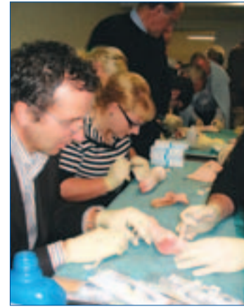
Am Tierpräparat konnten die Teilnehmer ihre Fertigkeiten probieren.