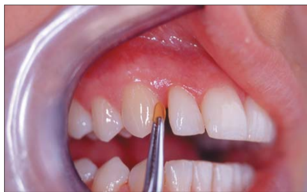
Behandlung einer Zahnfleischtasche von 5 mm im oberen Frontzahnbereich.

Dexcel-Pharma GmbH Röntgenstraße 1 63755 Alzenau Tel.: 0 60 23/94 80-0 Fax: 0 60 23/94 80-50 E-Mail: info@dexcel-pharma.de