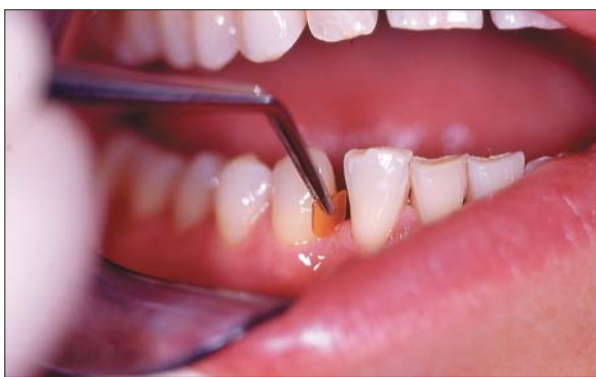
Insertion des PerioChip®-Einsatz bei Zahn 33 im Unterkiefer.

nicht die Gefahr der Entstehung opportunistischer Organismen wie Pilze und Hefe. Abgesehen von diesen belastenden Nebenwirkungen benötigen Sie eine echte Alternative, spätestens wenn Sie eine schwangere oder stillende Patientin behandeln müssen. Darüber hinaus müssen Sie bei der Verabreichung eines Antibiotikums auch immer die möglichen Wechselwirkungen und deren Konsequenzen in Betracht ziehen, die erfolgen können, wenn ein Patient systemisch wirkende Arzneimittel zur gleichen Zeit einnimmt.