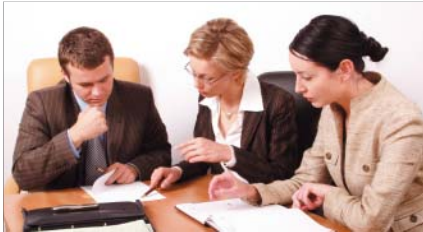
Die jährliche Qualitätsmanagementbesprechung sollte – gut organisiert – auch Spaß bereiten.

4 Schulungen planen. Einen Schulungsplan für interne