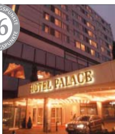
Der 14. IEC Implantologie-Einsteiger-Congress findet im Hotel Palace in Berlin statt.

16 FORTBILDUNGSPUNKTE FORTBILDUNGSPUNKTE