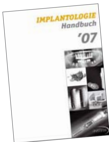
Jeder Teilnehmer des 14. IEC erhält ein aktuelles Compendium Handbuch „Implantologie“.

gerundet. Letztlich erhält jeder Teilnehmer das Handbuch 2007 „Implantologie“ – de facto den Kongress zum Mitnehmen, mit allen fachlichen Basics, Marktübersichten, Produktinformationen und der Vorstellung der wichtigsten implantologischen Fachgesellschaften und Berufsverbände sowie ein kostenloses Jahresabonnement des Implantologie Journals. Der 14. IEC Implantologie-Einsteiger-Congress bietet also jedem die Chance zu einer qualifizierten Team-Fortbildung.