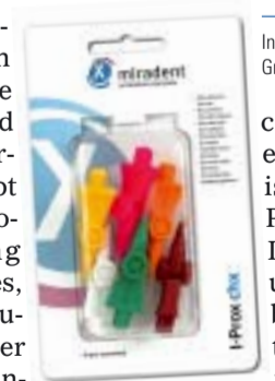
Interdentalbürste I-Prox ® chx in sechs Größen.

Das patentierte System zeichnet sich durch ihre flexible Winkelfunktion und antibakterielle Wirkung aus. Sie erlaubt eine individuelle Positionseinstellung des Bürstenkopfes, für einen leichten Zugang zu den schwer erreichbaren Zahnzwischenräumen. Zusätzlich sorgt die Chlorhexidin-Imprägnierung der einzelnen Borsten für eine gezielte Applikation des Wirkstoffes. Praktischerweise kann die zur hygienischen Aufbewahrung dienende Schutzkappe auch als Griffverlängerung verwendet werden. Die Bürsten sind in sechs farb-