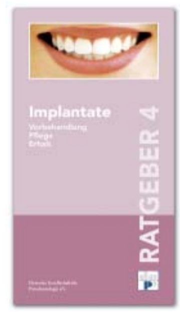
Der neue Patientenratgeber 4.