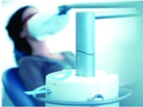
Abb. 1: Chairside Bleaching ist die schnellste Methode der Aufhellung.