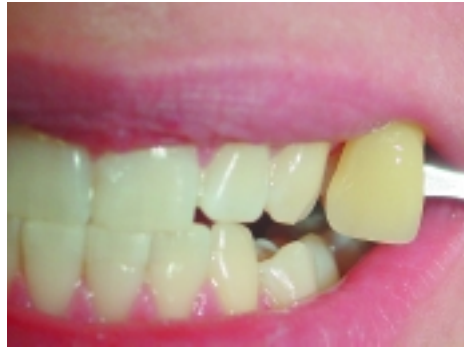
Abb. 2: Der „Aha Effekt“ des zahnärztlichen Bleachings wird sichtbar.

Man unterscheidet grundsätzlich Methoden, die der Patient „zu Hause“ durchführt, gegenüber solchen, die „Chairside“ oder „In-Office“, also in der Praxis durchgeführt werden. Ziel bei den Praxismethoden ist, in vertretbarer Zeit, also maximal 60–90 Minuten, einen möglichst hohen Effekt in einer Sitzung zu erzielen. Je nach Indikation entscheidet sich der Behandler für punktuelle abtragende Methoden und solche, die die Zahnschicht nicht angreifen.