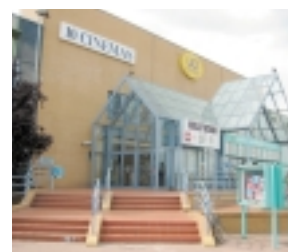
Am 26. Juni fand in der UCI-Kinowelt des Saaleparks bei Leipzig die Präsentation des neuen Keramikkonzepts Kiss statt.