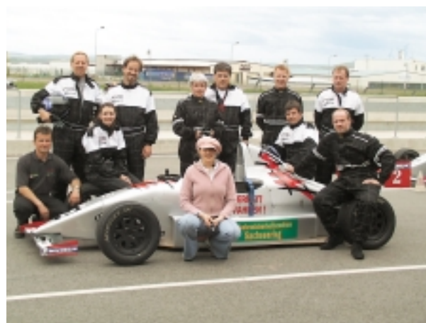
Der Besuch am IDS Messestand mit Information über das Ivoclar Vivadent Legierungsprogramm hat sich doppelt gelohnt. Die glücklichen Gewinner mit dem Formel-1-Boliden, den jeder um den Sachsenring steuern durfte.

Ein Wunschtraum ging für die Teilnehmer in Erfüllung, als sie sich zum Abschluss selbst ans Steuer eines echten Formel-1-Rennwagens setzen konnten. Der Rundenrekord auf dem Sachsenring blieb allerdings unangestastet. ☐