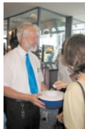
Unter den Teilnehmern wurde ein Kiss-Sortiment sowie zwei Kiss-Testsets verlost.