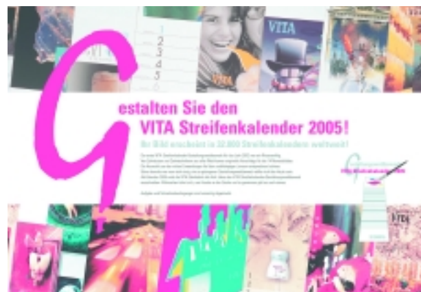
Internationaler Gestaltungswettbewerb für den VITA Kalender 2005.