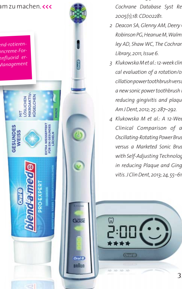
Abb. 3: Die Kombination aus oszillierend-rotierender Mundpflege und modernen Zahncreme-Formulierungen mit stabilisiertem Zinnfluorid ermöglichen ein häusliches Biofilm-Management auf höchstem Niveau.

Die vorangegangenen Ausführungen zeigen, dass nach dem heutigen Verständnis von oralen Biofilmen mechanische Biofilmentfernung und chemische Biofilmkontrolle gemeinsam eingesetzt werden sollten, um die Mundflora immer wieder in ihrer Entwicklung zurückzuwerfen. Dabei spielt die Unterstützung des Patienten eine entscheidende Rolle. Damit er eine möglichst effektive und zugleich schonende Mundpflege betreibt, ist es ratsam, ihn im Beratungsgespräch auf die Vorzüge oszillierend-rotierender Zahnbürsten und moderner Zahncreme-Formulierungen (z.B. Oral B/blend-a-med PRO-EXPERT) aufmerksam zu machen. <<<