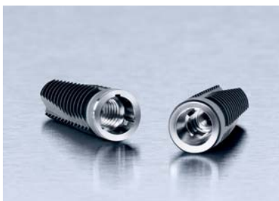
CAMLOG® SCREW-LINE Implantate und CONELOG® SCREW-LINE Implantate sind „Zwillinge“, die sich perfekt ergänzen.

Anwenderfreundliche Produkte, erstklassige Serviceleistungen, partnerschaftliche Kundenbeziehungen, ein faires Preis-Leistungs-Verhältnis und die überzeugenden Langzeitergebnisse des CAMLOG® Implantatsystems haben CAMLOG zu einem führenden Anbieter im Bereich der oralen Implantologie gemacht. Für implantologiestätige Behandlungsteams, die konische Implantat-Abutment-Verbindungen bevorzugen, hat CAMLOG sein Produktangebot erweitert und das CONELOG® Implantatsystem auf den Markt gebracht. Damit ist CAMLOG jetzt doppelt gut. Das CAMLOG® Implantatsystem wird auch in Zukunft kontinuierlich weiterentwickelt.