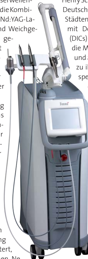
Der Lightwalker von Fotona, in Deutschland exklusiv bei Henry Schein.