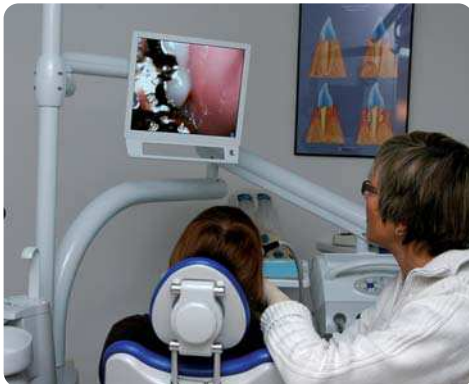
Gute Kommunikationsbedingungen dank intraoraler Kamera.

Informationen und in der Kommunikation von entscheidender Bedeutung und ein erster Schritt für die Patientenmotivation. In den verschiedenen Bereichen der Zahnmedizin sind Hilfsmittel wie Modelle, Fotos, Grafiken etc. zur visuellen Unterstützung von Beratungsinhalten ein absolutes Muss. Sie tragen erheblich zum besseren Verständnis und zur Motivation des Patienten bei. Unbestritten sind jedoch Bilder aus der eigenen Mundhöhle von zusätzlichem Vorteil, da sie einzig in der Lage sind, dem Patienten seine unmittelbare „Betroffenheit“ zu verdeutlichen. Hier ist „betroffen“ auch im übertragenen Sinne zu interpretieren: Es ist gerade diese „Betroffenheit“, die bei dem Patienten den Wunsch und die Motivation nach einer Veränderung bewirkt. Je präziser das Problem gezeigt und verdeutlicht werden kann, umso größer wird oft auch der Wunsch nach einer Veränderung im Patienten wachsen. Die Vermittlung eines ausreichenden Fachwissens ist die Voraussetzung für den Patienten, damit er seine eigene Erkrankung erkennt und die ihm von uns angebotenen Präventionsmaßnahmen als einen aktiven Beitrag zu seiner Mundgesundheit schätzen lernt und akzeptiert.