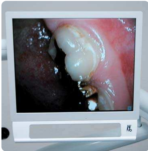
Erkennbare Veränderungen überzeugen für Therapiemaßnahmen.

Wenn es um die Mundsituation geht, so ist nur ein geringer Teil im Bereich der Front und dabei vor allem labial für den Patienten gut sichtbar. Eine visuelle Wahrnehmung von Zähnen und Zahnfleisch beim alltäglichen Kontrollblick im Spiegel ist auf den Abschnitt zwischen den Eckzähnen beschränkt, und da es sich um vergleichsweise „kleine Objekte“