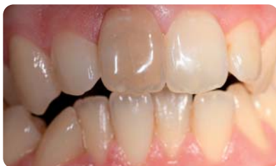
Abb. 3: Ausgangssituation Fall 2.

Beim Walking-Bleaching wird nach Abtragung der Wurzelfüllung um ca. 2 mm unter die Schmelz-Zement-Grenze die applizierte Bleicheinlage für mehrere Tage in der Kavität