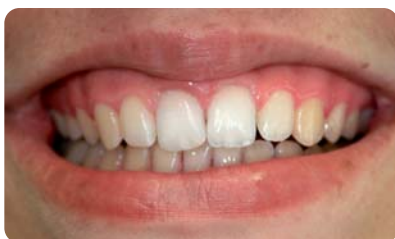
Abb. 2: Endergebnis Fall 1.

Bei der thermokatalytischen Bleichmethode wird das Bleichmittel durch eine Halogenlampe oder durch Einbringen von heißen