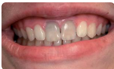
Abb. 1: Ausgangssituation Fall 1.

Innere Verfärbungen devitaler Zähne ergeben sich durch den traumatisch bedingten Austritt von Blutprodukten oder endodontischer Substanzen mit Diffusion in die Dentintubuli. Extreme Verfärbungen können sich bei weiten Dentintubuli jugendlicher Zähne einstellen. Bräunliche Verfärbungen entstehen durch die Verbindung von bei der Hämolyse freigesetztem Eisen mit durch Bakterien gebildeten Schwefelwasserstoff. Bestimmte Wurzelfüllmaterialien können orange-rote Farbveränderungen bewirken. Bekannt sind ebenfalls grau-schwarze Verfärbungen korrosionsbedingt z. B. durch Silberstifte.