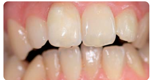
Abb. 8: Endergebnis Fall 2.

Mit dem neuen In-Office-System pola office+ können Patienten durch Verkürzung der Einwirkzeiten schneller weißere und hellere Zähne erhalten. Die einfache Anwendung im Spritzensystem mit zwei Kammern ist wirtschaftlich und optimiert den Workflow in der Praxis. Die Integration desensibilisierender Zusatzstoffe zu 37,5% Wasserstoffperoxid und der neutrale pH-Wert machen pola office+ zum idealen Zahnaufhellungssystem für vitale und avitale Zähne. In den vorgestellten Patientenfällen steht das professionelle Bleaching für eine minimalinvasive Behandlung, die dem Behandler Spaß macht und den Patienten wieder lachen lässt. ◀