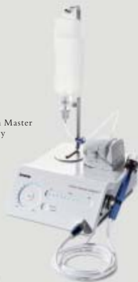
Piezon Master Surgery

EINZIGARTIG in der Welt der Chirurgie – das 3-Touch-Panel zur intuitiven Bedienung.