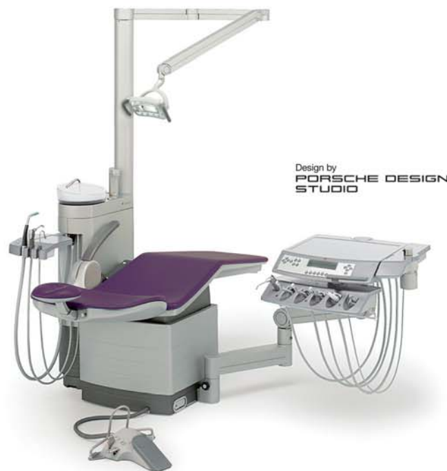
Design by PORSCHE DESIGN STUDIO