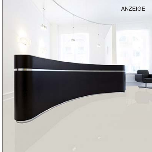
Räume für höchste Ansprüche

Unter Corporate Design (kurz CD) wird die visuelle Identität, also die Unternehmenserscheinung verstanden. Wie Verpackungen, Kommunikationsmittel und Architektur, die als Erscheinungsbild oder visuelle Identität Teil der Corporate Identity ist. Corporate Design findet Anwendung bei der Gesamtgestaltung von Logos, Internetpräsenz, Geschäftspapiere, Möbeldesign, Innenarchitektur usw. Corporate Design ist die Bindung an einen einheitlich sichtbaren Außenauftritt. Hier müssen Gestaltungselemente klar und eindeutig definiert sein, die visuelle Ausformung und die Qualität müssen zum Image passen und konsequent umgesetzt werden. Um die Marketingstrategie zu verstärken, ist ein immer stärker kommender Trend, den Firmensitz und dessen Räumlichkeiten, die Philosophie des Unternehmens widerspiegeln zu lassen. Wenn die Unternehmenseinrichtung zum Erscheinungsbild passen soll, dann spricht man auch hier von Corporate Design. Ein Innenarchitekt würde aber eher den Ausdruck Corporate Interior, Unternehmensinnenarchitektur ver-