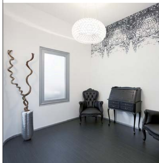
Planung Design Abwicklung