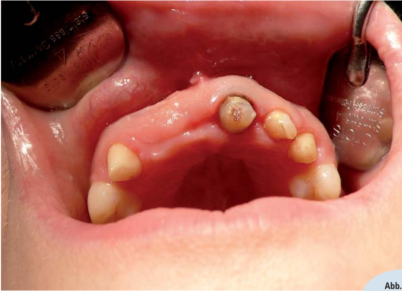
Abb. 3: Die Situation nach drei Wochen.

ges, wenn die grundlegenden Regeln des OP-Protokolls nicht eingehalten werden. Um etwaige iatrogene Misserfolge auszuschließen, darf ich daher das folgende Behandlungsprotokoll nahelegen: