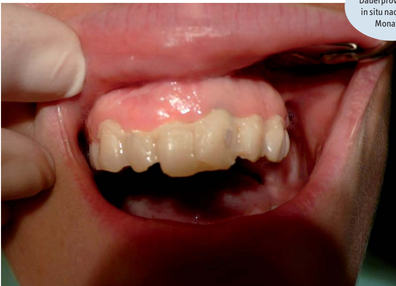
Abb. 4: Das Dauerprovisorium in situ nach sechs Monaten.