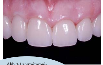
Abb. 1: Langzeitprovisorische Versorgung der Oberkiefer-Frontzähne zur Evaluierung ästhetischer und funktioneller Aspekte. Deutlich fällt der ungleichmäßige Verlauf der marginalen Gingiva im Bereich des Zahnes 21 ins Auge.