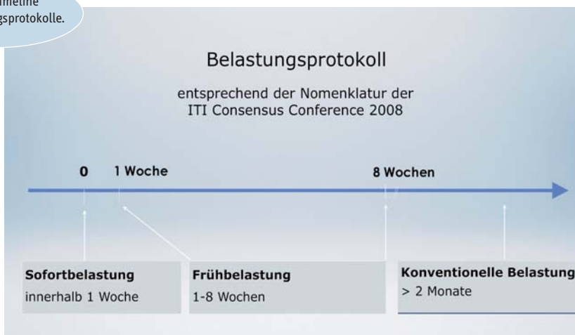
Abb. 2: Timeline der Belastungsprotokolle.

Ziel von Konsensuskonferenzen ist es, anhand klinischer Studien Empfehlungen für die Einheilzeiten abzugeben. 2008 wurden dabei klinische Studien zu den Themen Sofort-, Früh- und konventionelle Belastung in Abhängigkeit von der anatomischen Region und der prothetischen Versorgung analysiert. Anhand einer systematischen Literaturlauswertung wurden insgesamt 2.371 Abstrakte gelesen, 295 Volltextartikel untersucht und 60 Studien in den Übersichtsartikel eingeschlossen. 1 Die Implantatüberlebensraten wurden sowohl für den Ober- und Unterkiefer als auch deren Unterteilung in anterior und posterior und der