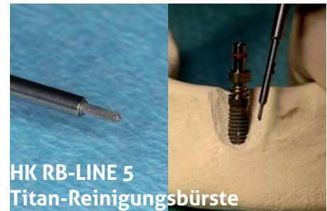
HK RB-LINE 5 Titan-Reinigungsbürste

KENTZLER-KASCHNER DENTAL GmbH Mühlgraben 36 73479 Ellwangen / Jagst Telefon: +49 (7961) 9073-0 Fax: +49 (7961) 52031 e-Mail: info@kkd-topdent.de