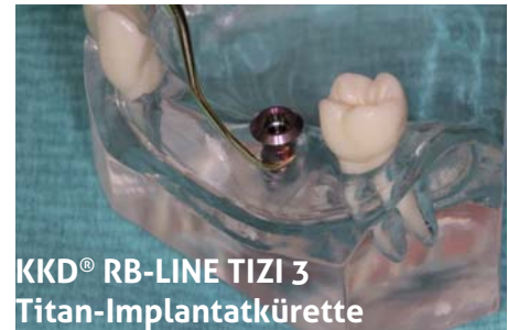
KKD® RB-LINE TIZI 3 Titan-Implantatkurette