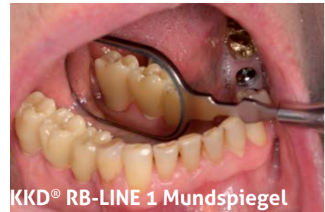
KKD® RB-LINE 1 Mundspiegel