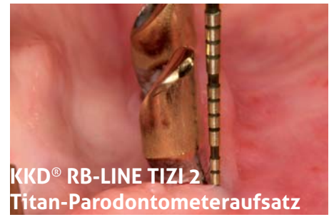
KKD® RB-LINE TIZI 2 Titan-Parodontometeraufsatz