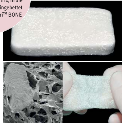
Abb. 1: Das synthetische Knochenersatzmaterial Matri™ BONE MAX ist bei dem Implantathersteller m&k erhältlich. – Abb. 2: Dank der Kollagen-Matrix, in die das Knochenersatzgranulat eingebettet ist (REM links), lässt sich Matri™ BONE MAX flexibel formen (rechts).

In vielen klinischen Situationen ist das eigene Regenerationsvermögen des natürlichen Knochengewebes nicht ausreichend und knochenaufbauende Maßnahmen sind erforderlich. Welche Technik und welches Material hierbei zum Einsatz kommen, ist situationsabhängig zu entscheiden. Grundsätzlich sind Augmentationsmaterialien in großer Vielfalt verfügbar. Zwar gilt das autologe Knochentransplantat im Allgemeinen als Goldstandard, aber es sind mittlerweile auch allogene und synthetisch hergestellte Knochenblöcke auf dem Markt erhältlich, mit denen vorzeigbare Ergebnisse erzielt werden können.