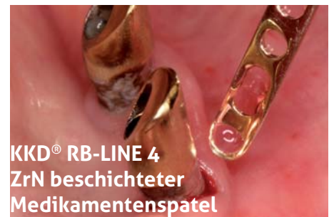
KKD® RB-LINE 4 ZrN beschichteter Medikamentenspatel